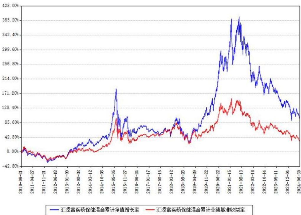
汇添富医药保健混合累计净值增长率与同期业绩基准收益率对比图

(二)自基金合同生效以来基金累计净值增长率变动及其与同期业绩比较基准收益率变动的比较图